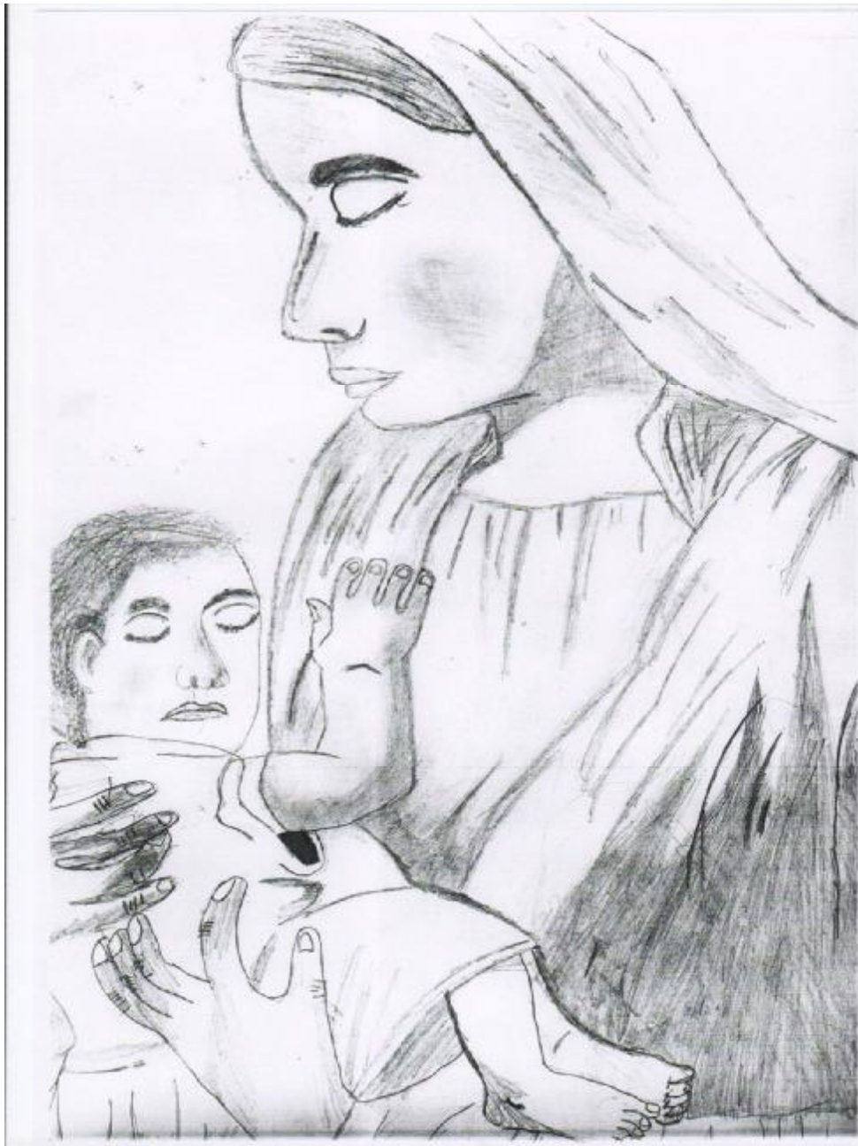
Tvorba časopisu: p. uč. Gazdíková Jazyková úprava: p. uč. Lukáčová