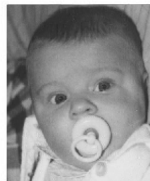
obr. č. 1.