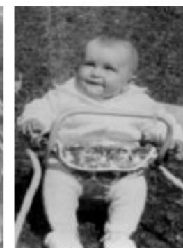
obr. č. 3.