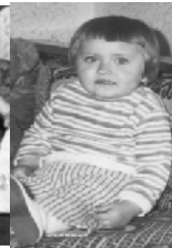
obr. č. 5.