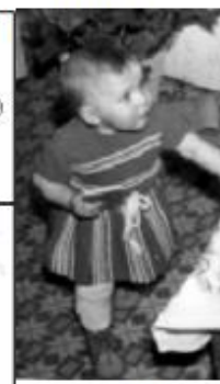
obr. č. 4.