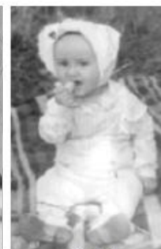
obr. č. 2.