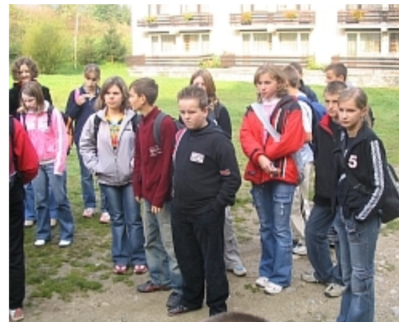
Žiaci 8. a 9. ročníka na zemepisnej exkurzii v Janoškových dierach

Fotografie odovzdajte pani učiteľke Gazdíkovej.